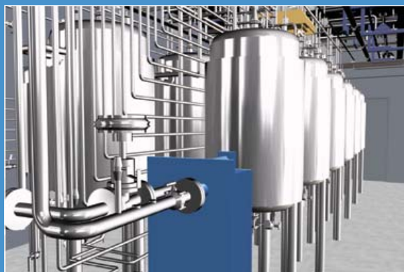
Bufferforlag fra CMC

PWE har afsluttet designopgaven vedrørende buffer preperationsanlægget, og dermed er den sidste del af projektering til CMC afsluttet.